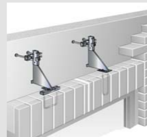
Fenster- oder Türöffnungen, z.B. mit Fertigteilstürzen